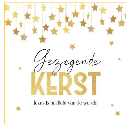
Deze stond op Kaartje2Go

Dank Hem, dat je leven mag. Dat je Zijn leven leven mag. Dat je een hele zuivere heldere bron mag zijn. En dat Hij je geduld en volharding geeft.