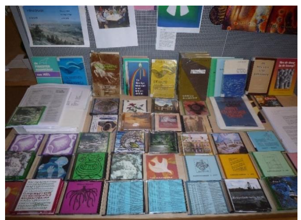
Een overzicht van de infotheek