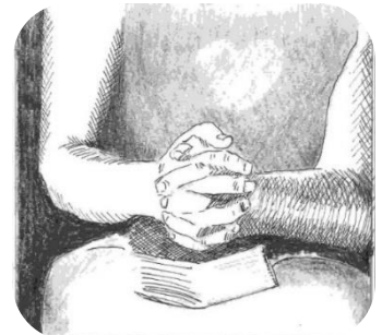
Illustratie van Evelien van Eekeren

Wat is het heerlijk om te weten dat er een goede God is die trouw is aan Zijn plan. Snoep van deze korte stukjes en ik hoop dat u er rijker en gelukkiger van wordt!