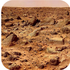
De planeet Mars

Ik vermoed dat de hierboven geschetste toestand waarin de aarde geschapen is (nog niet door God bekleed) de toestand is waarin de overige planeten van het zonnestelsel nu zijn. God is met de aarde verdergegaan; met die andere planeten niet. We hebben in onze tijd een concreet beeld gekregen van het landschap op de maan, van het oppervlak van Mars. Beide zijn woest en leeg, onherbergzaam en niet mooi. Als God het wil, kan dat natuurlijk nog veranderen. Zo goed als God met de aarde verder is gegaan, zal Hij ook met andere planeten verder kunnen gaan. Zij zullen in den beginne niet voor niets tot aanzijn geroepen zijn.