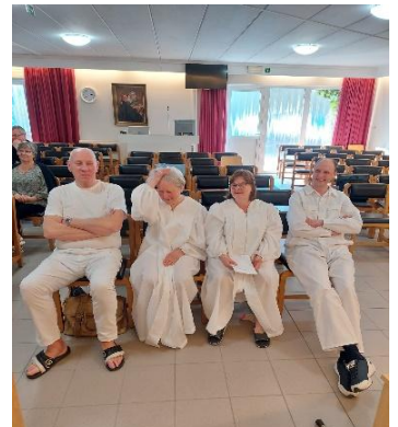
Feestelijke doopdienst te Hasselt (B) op 27-03-2022

Hij was door de Geest verwekt tot de Zoon van God (Matth. 1:20; Luk. 1:35), maar Hij leefde wel “in de gelijkheid van het vlees van zonde” (Rom. 8:3, grondtekst) als wij, maar “zonder te zondigen” (Hebr. 4:15). Zo wilde Hij Zich geheel aan Gods wil overgeven en Gods wil geheel volbrengen. Daar gaf Hij Zich restloos aan God, geheel en al toegewijd. Deze doortastende keuze in geloof en gehoorzaamheid geldt ook voor ons: Ik wil Jezus volgen en in mijn leven alle gerechtigheid vervullen! (Wordt vervolgd)