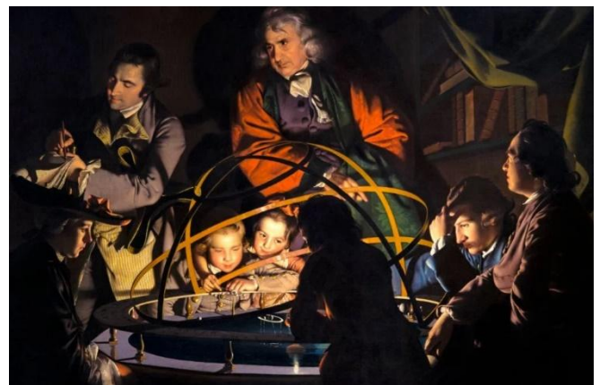
De Verlichting: De filosoof geeft uitleg bij een model van het zonnestelsel

Te beginnen bij “het begin van kennis” verhoogt niet noodzakelijk je IQ. Maar het doet iets beters dan dat. Het verlicht je verstand en dat helpt pas echt (E) . Niet beginnen bij het begin van kennis verduistert je verstand (F) . Rond het jaar 1700 begon, wat men in de geschiedenisboeken aanduidt als de tijd van de ‘Verlichting’.